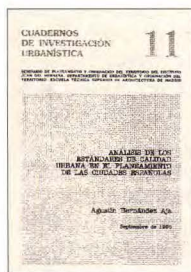
Escuela Técnica Superior de Arquitectura 19 x 27 cm.