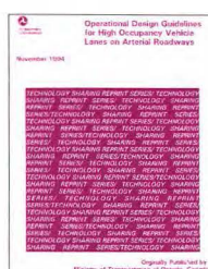
U.S. Department of Transportation, 1994 (Originalmente publicado por el Ministerio de Transportes de Ontario, Canadá.) 164 páginas 21 x 28 cm.